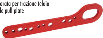
Art. 123 | Piastra forata per trazione telaio Multi hole pull plate