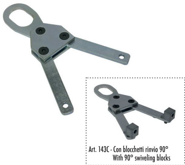
Art. 143C - Con blocchetti rinvio 90° With 90° swiveling blocks

MULTIPURPOSE can be easily attached even to non - aligned points of the car body; in spite of this, the traction always extends perpendicular to the application line.